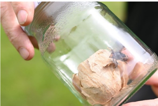
... pour conservation